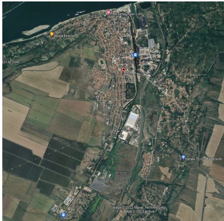
Фигура 2. Пространствено разположение на ромските гетоизирани структури в гр. Лом

Забележка: С цифрата „1“ е обозначен квартал „Стадиона“; с цифрата „2“ квартал „Младеново“, а с цифрата „3“ - квартал „Хумата“.